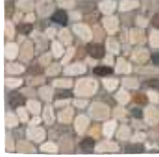
CIOTTOLI 2 MIX