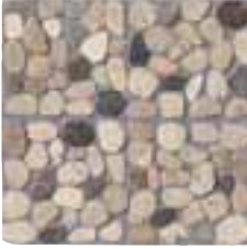
CIOTTOLI 4 MIX