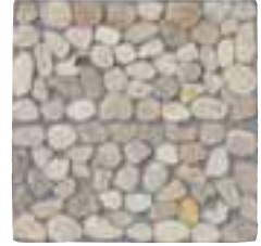
CIOTTOLI 2 LIGHT