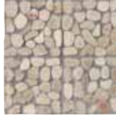
CIOTTOLI 4 LIGHT